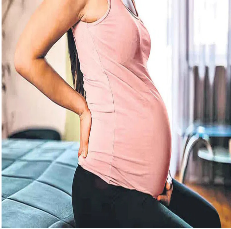
ఈ సమయంలో పెంపుడు జంతువుల వ్యర్థాలు శుభ్రం చేయడం కూడా మంచిది కాదు. వాటిలోని బ్యాక్టీరియా ఇన్ఫెక్షన్లకు దారితీసి.. కడుపులోని బిడ్డ ఆరోగ్యాన్ని ప్రభావితం చేయవచ్చు.

ఎత్తు ఎక్కడం, అది కూడా ఏదైనా బరువైన వస్తువును పట్టుకుని ఎక్కడం ఏమంత క్షేమం కాదు. గర్భంతో ఉన్నప్పుడు శరీర సమతుల్యత భిన్నంగా ఉంటుంది. కాబట్టి త్వరగా అదుపు తప్పే ప్రమాదం ఉంది.