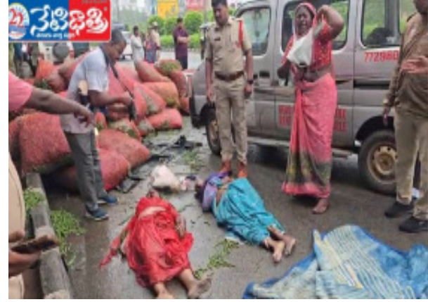
బస్ స్టాప్ లోకి దూసుకెళ్లిన బోలెరో.. ముగ్గురు మహిళల దుర్మరణం

రాజేంద్రపేట, నేటిధాత్రి: రంగారెడ్డి జిల్లా, శంషాబాద్ సమీపంలోని శాతంరాయి గ్రామం వద్ద గురువారం ఉదయం ఘోర రోడ్డు ప్రమాదం చోటుచేసుకుంది. బస్ స్టాప్ లో బస్సు కోసం వేచి చూస్తున్న మహిళలపై మిర్చి లోడితో వెళ్తున్న బోలెరో వాహనం అదుపుతప్పి దూసుకెళ్లడంతో ముగ్గురు మహిళల అక్కడికక్కడే మృతి చెందినట్లు సమాచారం. ప్రత్యక్ష సాక్షుల కథనం ప్రకారం, ముందు వెతుక్కు వాహనాన్ని తప్పించి చేరుతుంటే బోలెరో ఒక్కసారిగా స్పిడ్ అయి రోడ్డు