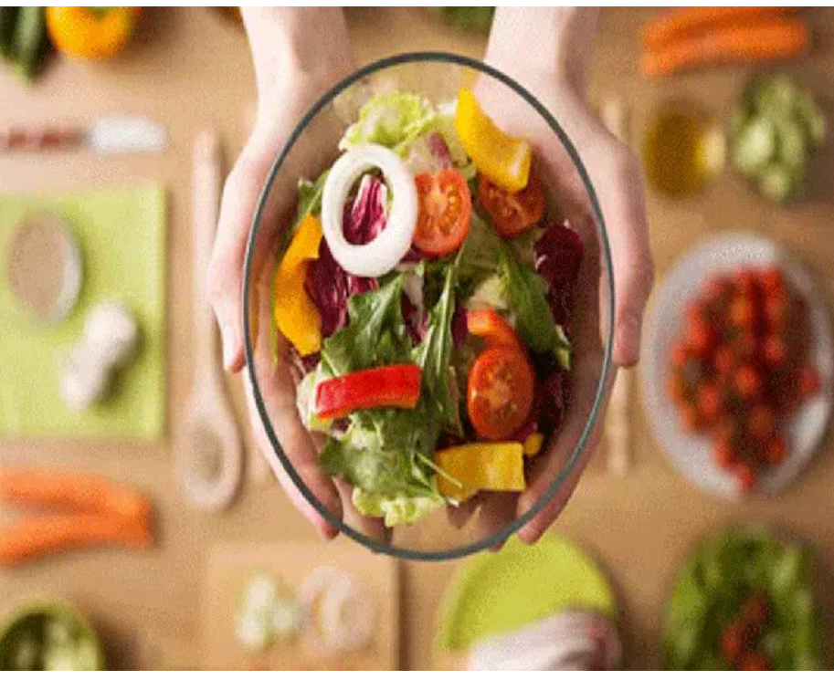
సమతుల్య ఆహారం మితాహారం తగినంత నీరు తీసుకోవాలి మొక్కల ఆధారిత ప్రోటీన్స్ తీసి పదార్థాలకు చెక్ ఆరోగ్యకర కొవ్వులు మనసుపెట్టి తినడం సోడియం వాడకం తగ్గించాలి మితాహారంతో పాటు ఇంట్లో తయారుచేసిన ఆహారాన్నే తీసుకోవాలని, ప్రాసెస్డ్ ఫుడ్ కు దూరంగా ఉండాలని పోషకాహార నిపుణులు చెబుతున్నారు. ఇక మెరుగైన ఆరోగ్యం కోసం ఈ సూచనలు పాటించాలని పేర్కొంటున్నారు.

న్యూఢిల్లీ : ఆరోగ్యం మెరుగుపడేందుకు, జీవన శైలి వ్యాధుల ముప్పు నుంచి తప్పించుకునేందుకు సమతుల్య ఆహారం తప్పనిసరిగా తీసుకోవాలని పోషకాహార నిపుణులు సూచిస్తున్నారు. నూతన ఏడాదిలో మీ ఆహారపు అలవాట్లు, జీవనశైలిని మార్చుకునేందుకు ఇదే సరైన సమయం. ఆరోగ్యకర జీవనశైలిని అలవరుచుకోవడం స్వాస్థ్య ఇయర్ రిజల్యూషన్ గా ఎంచుకోవచ్చు. మెరుగైన ఆరోగ్యం కోసం పోషకాహార నిపుణులు పలు సూచనలు చేస్తున్నారు. రోజూవారీ ఆహారంలో భాగంగా వండ్లు, కూరగాయలు, ప్రోటీన్స్, పప్పు ధాన్యాలు, ఆరోగ్యకర కొవ్వులు తీసుకోవడం ద్వారా శరీరానికి అవసరమైన అత్యవసర పోషకాలు, ఫైబర్, యాంటీఆక్సిడెంట్లు ఆహారం ద్వారా సమకూరుతాయి. అయితే ఏదీ తీసుకున్నా