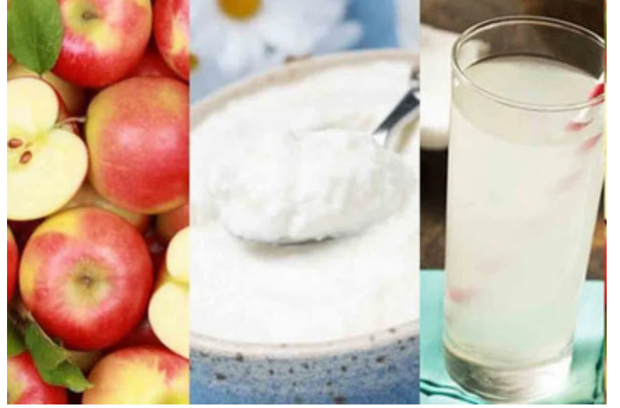
పుగర్, పుగర్ అధికంగా ఉన్న ఫుడ్స్, సూనె పదార్థాలు, ప్రోటీన్ షేక్స్ (వీటిని వర్కవుట్స్ అనంతరం తీసుకోవచ్చు), డైరీ డ్రింక్స్, కార్బోహైడ్రేట్లు అధికంగా ఉన్న ఆహార పదార్థాలకు దూరంగా ఉండాలి.

వ్యాయామానికి ముందు మీరు ఏం తీసుకున్నారనేది మీ వర్కవుట్ సామర్థ్యం సహా పలు అంశాలపై ప్రభావం చూపుతుందని నిపుణులు చెబుతున్నారు. ఖాళీ కడుపుతో వర్కవుట్స్ చేయరాదని, ఫిట్నెస్ లక్ష్యాలను అందుకోవాలంటే వర్కవుట్స్ ముందు ఆరోగ్యకర ఆహారం తీసుకోవాలి. మంచి పోషకాహారం శరీరానికి ఉత్తేజం ఇవ్వడంతో పాటు వ్యాయామ సామర్థ్యాన్ని కూడా పెంచుతుంది. కండరాలు దెబ్బతినే ముప్పును కూడా ఇది నివారిస్తుంది. ప్రి వర్కవుట్ స్నాక్స్ లో ప్రోటీన్, కార్బోహైడ్రేట్లు, కొవ్వుల మధ్య సమతుల్యం పాటించాలి. వీటి మధ్య సరైన బ్యాలెన్స్ పాటిస్తే శరీరానికి శక్తి సమకూరడంతో పాటు కండరాలు వృద్ధి చెందుతాయి. ప్రి వర్కవుట్ స్నాక్స్ కోసం పీనట్ బటర్తో యాపిల్, దానిని అతర సీడ్స్ తో కూడిన పెరుగు, నజ్జా గింజలతో కొబ్బరి నీళ్లు, బాయిల్డ్ ఎగ్స్, బ్లాక్ కాఫీ వంటివి తీసుకోవచ్చు. ఇక వ్యాయామానికి ముందు