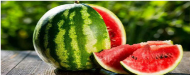
కొడుతున్నది. ఇలా, ఎన్నో పోషకాలతో నిండిన తర్జూబు చరిత్రపైనా తనదైన ముద్ర వేసింది.

ఈ వేసవిలో కూడా ఎండలు మందుతాయని వాతావరణ శాఖ అంచనాలు వేస్తున్నది. ఇంకేముంది.. వ్యాపారులు పందిళ్లు వేసుకుని మరీ షర్టులు, పండ్లరసాల అమ్మకాలు మొదలుపెడతారు. ఎన్నన్నా చల్లదనానికి తర్జూబుకు సాటివచ్చే పండు లేదు అంటారు పోషకాహార నిపుణులు. మనం 'అహా' అంటూ ఆరగిస్తున్న ఎర్రలెర్రీ, తియ్యతియ్యలే తర్జూబు శతాబ్దాలుగా ఎన్నో మార్పులకు లోబడింది. అధ్యయనాల ప్రకారం తర్జూబు మూలాలు అఫ్రికా ఖండంలో ఉన్నాయి. అక్కడినుంచి మధ్యదరా దేశాలకు, ఇతర ఐరోపా ఖండ దేశాలకు చేరుకుంది. దక్షిణ అఫ్రికా దేశాల్లో పెరిగే సిట్రస్ మెలన్లను ఇప్పటి తర్జూబుకు పూర్వీకులుగా భావిస్తున్నారు. పశ్చిమ అఫ్రికాలో దొరికే ఎగుని మెలన్ మరో ప్రసిద్ధి తర్జూబు రకం. అయితే అక్కడి ప్రజలు పండు కోసం కాకుండా, విత్తనాల నిమిత్తం సాగుచేయడం అనశ్చికం. కాకపోతే తర్జూబు వన్య రకాలు కొంచెం చేదుగా ఉంటాయి. మళ్ళీ తినబుద్ధికారు. ఇంకొన్నామో చప్పచప్పగా ఉంటాయి. అయినా సరే, అఫ్రికా ప్రజలు వీటి సాగును వదిలిపెట్టలేదు. నీళ్లు దొరకని సమయంలో భీదంగా దాచుకున్న తర్జూబు రసాన్ని తాగి దాహార్తి తీర్చుకునేవారు. తర్జూబు కాలంలో ఎంపికచేసిన కాయల విత్తనాలను సేకరించి.. ఇప్పుడు మనం తింటున్న తియ్యటి పండ్లుగా రూపాంతరం చెందించారు.