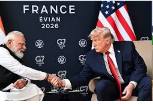
వాణిజ్య చర్యలు త్వరలో పూర్తి కానున్నట్లు తెలిపారు. ఇంధన సరఫరాను పెంచడానికి భారత్-అమెరికా కలిసికట్టుగా పనిచేస్తున్నారన్నారు. చమురు శుద్ధి చేయడానికి సామర్థ్యం ఉన్న కొన్ని దేశాల్లో భారత్ కూడా ఒకటిగా పేర్కొన్నారు. ప్రధాని నరేంద్ర మోదీపై రూబియో ప్రశంసలు కురిపించారు. తాను ఆయనకు అభిమానినని తెలిపారు. ప్రపంచ వేదికపై భారత్ చేత స్థాయిని పెంచిన ఘనత ఆయనకే దక్కుతుందన్నారు. మోదీ భారత్ ను ఒక ప్రపంచ శక్తిగా మార్చారని కొనియాడారు. భారత్-అమెరికా బంధం ప్రస్తుతం ఎంతో బలంగా ఉందని మార్క్ రూబియో పేర్కొన్నారు. వైట్ హౌస్ లో అవిఎన్ఎస్ కు ఇచ్చిన ప్రత్యేక ఇంటర్వ్యూలో రూబియో మాట్లాడారు. “వచ్చే ఏడాది ప్రారంభంలో అధ్యక్షుడు ట్రంప్ భారత్ పర్యటనకు వచ్చేలా ప్రయత్నాలు చేస్తున్నాం. అదే మా లక్ష్యం” అని చెప్పారు. అలాగే అమెరికాకు భారత్ అత్యంత సన్నిహిత భాగస్వామి అన్నారు. ప్రధాని నరేంద్ర మోదీ, అధ్యక్షుడు ట్రంప్ మధ్య ఉన్న స్నేహం ద్వైపాక్షిక బంధాలను మరింత బలోపేతం చేస్తోందని వ్యాఖ్యానించారు. అలాగే ఇరు దేశాల మధ్య వాణిజ్య ఒప్పందంపై చర్యలు తుది దశకు చేరుకున్నాయని కూడా రూబియో తెలిపారు. ఈ ఒప్పందం త్వరలోనే ఖరారుయ్యే అవకాశాలు ఉన్నాయని, దీనివల్ల భారత్-అమెరికా ఆర్థిక, పూర్వోత్తర సంబంధాలు మరింత బలపడతాయని ఆశాభావం వ్యక్తం చేశారు. అలాగే క్యాబ్ దేశాల నేతల సమావేశం కూడా త్వరలో నిర్వహించాలని అమెరికా ఎదురుచూస్తోంది చెప్పారు.

వాషింగ్టన్, నేటిధత్తి: అమెరికా అధ్యక్షుడు డొనాల్డ్ ట్రంప్ వచ్చే ఏడాది ఆరంభంలో భారత్ పర్యటనకు వచ్చే అవకాశం ఉందని ఆగ్రాజ్య విదేశాంగ మంత్రి మార్క్ రూబియో వెల్లడించారు. ట్రంప్ భారత్ పర్యటన కోసం ఇప్పటికే ఏర్పాట్లు ప్రారంభించామని, ఈ ఏడాది చివర్లో తాను భారత్ కు వచ్చి పర్యటనకు సంబంధించిన ఏర్పాట్లను సమీక్షించిన తరువాత, భారత్-అమెరికా మధ్య సంబంధాలు అద్భుతమంటూ కొనియాడారు. అధ్యక్షుడి పర్యటనకు సంబంధించిన ఏర్పాట్లు ఖరారు చేయడానికి ఈ ఏడాది ముగిసేలోపే తాను భారత్ కు వెళ్లాలని పేర్కొన్నారు. రెండోసారి అధికారంలోకి వచ్చిన తర్వాత ట్రంప్ మొదటి భారత్ పర్యటన ఇదే కానుంది. అమెరికాకు భారత్ అత్యంత సన్నిహిత భాగస్వామి అని, ప్రధాని నరేంద్ర మోదీ-ట్రంప్ మధ్య మంచి అనుబంధం ఉందని మార్క్ రూబియో తెలిపారు. దౌత్యపరంగా వారి బంధం చాలా ఉపయోగకరమన్నారు.