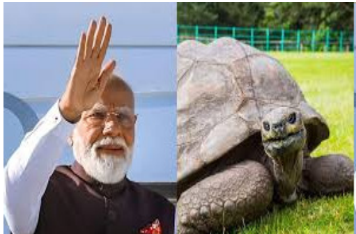
వన్య చారిత్రక సందర్శనలకు సాక్షిగా నిలిచింది. వయసు మీదపడినా ఆ తాబేలు మాత్రం ఆరోగ్యంగా ఉన్నట్లు తెలుస్తోంది. వెటర్నరీ డాక్టర్లు దాని ఆరోగ్యాన్ని ఎప్పటికప్పుడు పరీక్షిస్తున్నారు. అయితే వయసు తీరితూ ఆ తాబేలుకు కంటి చూపు మందగించింది. వాసన గుర్తుపట్టే గుణాన్ని కూడా కొంత కోల్పోయినట్లు తెలుస్తోంది.

న్యూఢిల్లీ, నేటిధత్తి: హిందూ మహాసముద్ర ద్వీపం సీషెల్స్లో వచ్చే వారం ప్రధాని మోదీ పర్యటించనున్నారు. ఆ పర్యటన వేళ ఆయన అత్యధిక నేషనల్ టెలివిజన్ గారెన్టీను సందర్శించనున్నారు. షెడ్యూల్ ప్రకారం ఆయన అత్యధిక వృక్షాన్ని చూడనున్నారు. భారత్ సీషెల్స్ మధ్య 50 ఏళ్ల చౌకైన బంధానికి ప్రతీకగా ప్రధాని మోదీ ఈ పర్యటన చేపట్టనున్నారు. సీషెల్స్ జాతీయ దినోత్సవ సందర్భాల్లో మోదీ గౌరవ అతిథిగా సాల్వాంటారు. ఇక ప్రపంచంలో ప్రాణాలతో ఉన్న అతి వృద్ధ జంతువును కూడా ప్రధాని మోదీ దర్శించుకోనున్నారు. 1832లో వృద్ధిని తాబేలును ఆయన దీక్షించారు. ఆ తాబేలు పేరు జోనాథన్. ప్రస్తుతం అది సుమారు 194 ఏళ్ల వయసు ఉంటుందని గిన్నెస్ వరల్డ్ రికార్డు అంచనా వేసింది. సుమారు రెండు శతాబ్దాలకు చేరుకున్న ఆ జంతువు