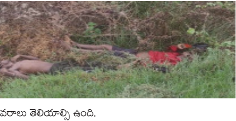
వివరాలు తెలియాల్సి ఉంది.

కోడూడ, నేటిధాత్రి: పట్టణ పరిధిలోని శ్రీరంగాపురం వద్ద జాతీయ రహదారిపై ఇద్దరు కూలీలు అనుమానస్పద స్థితిలో మృతి చెందడం స్థానికంగా కలకలం రేపింది. గత రెండేళ్లుగా కోడూడలోని రైస్ మిల్లలో హమాలీలుగా పనిచేస్తున్న ఈ కూలీలు రోడ్డు ప్రమాదంలో చనిపోయారా లేక హత్యకు గురయ్యారా అనే కోణంలో పోలీసులు దర్యాప్తు నిర్వహిస్తున్నారు. పూర్తి