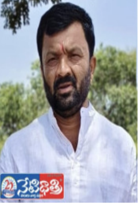
తీసుకోవాలని గ్రామస్థులు డిమాండ్ చేస్తున్నారు. అలాగే ప్రజల ఆరోగ్య రక్షణకు ప్రభుత్వం తక్షణ చర్యలు చేపట్టాలని విజ్ఞప్తి చేస్తున్నారు.

జహీరాబాద్, నేటిదాటి: సంగారెడ్డి జిల్లా జహీరాబాద్ మండలం అల్గోల్ గ్రామంలోని “ఎస్ ఎస్ వి” రెడిమిక్స్ సంస్థపై స్థానికులు తీవ్ర ఆరోపణలు చేస్తున్నారు. కాలుష్య నియంత్రణ నిబంధనలను ఉల్లంఘిస్తూ సంస్థ కార్యకలాపాలు నిర్వహిస్తోందని, తెలంగాణ కాలుష్య నియంత్రణ మండలి ( టి ఎన్ పి సి బి ) బలమూర్తు నోడీసులు జారీ చేసినప్పటికీ సంస్థ నుంచి సరైన స్పందన లేదని గ్రామస్థులు ఆరోపిస్తున్నారు. అధికారిక రికార్డుల ప్రకారం ఈ యూనిట్ గతంలో కాలుష్య నియంత్రణ అనుమతులు (కాన్సెన్ట్ ఆర్డర్ ) జారీ అయ్యాయి. గ్రామస్థుల కథనం ప్రకారం, ప్లాంట్ నుంచి వెలువడుతున్న దుమ్ము, సిమెంట్ కణాలు, ఇతర కాలుష్యాల కారణంగా వరిసర ప్రాంత ప్రజలు ఆరోగ్య సమస్యలు ఎదుర్కొంటున్నారని, దీర్ఘకాలంలో క్యాన్సర్ వంటి తీవ్రమైన వ్యాధులు వచ్చే ప్రమాదం ఉందని భయాందోళనలు వ్యక్తం చేస్తున్నారు. అయితే ఈ ఆరోపణలకు సంబంధించి శాస్త్రీయ రీచా వైద్యపరమైన నిర్ధారణ ప్రజలకు అందుబాటులో లేదు. అధికారులకు బలమూర్తు ఫిర్యాదులు చేసినప్పటికీ శాశ్వత పరిష్కారం లభించడం లేదని, కొంతమంది రాజకీయ నాయకులు అందరినీ సంతకం చేస్తూ కార్యకలాపాలు కొనసాగిస్తోందని స్థానికులు ఆరోపిస్తున్నారు. ఈ ఆరోపణలపై సంబంధిత అధికారులు, సంస్థ యాజమాన్యం స్పందించి వాస్తవాలను వెల్లడించాలని ప్రజలు కోరుతున్నారు. కాలుష్య నియంత్రణ మండలి అధికారులు మరోసారి సమగ్ర తనిఖీ నిర్వహించి, నిబంధనలు ఉల్లంఘించినట్లు తేలితే చట్టప్రకారం కఠిన చర్యలు