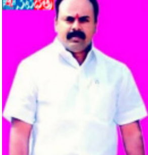
కచ్చిపంగా బీఆర్ఎస్ పార్టీ అధికారంలోకి వస్తుంది, ప్రజా సంక్షేమాల, అభివృద్ధి ఫలాలు మనందరికీ అందుతాయని ఆశాభావం వ్యక్తం చేశారు. గులాబీ పార్టీలో పని చేస్తున్నందుకు మనందరం గర్వపడాలని, పార్టీలో ప్రతి కార్యక్రమ ప్రత్యేక గుర్తింపుతో పాటు గౌరవం కూడా ఉంటుందనే విషయాన్ని గుర్తుంచుకోవాలన్నారు.