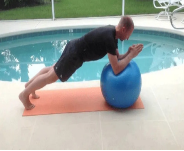
వ్యాయామంతో గుండె ఆరోగ్యం మెరుగు బరువు నియంత్రణ బీపీ నియంత్రణ అదుపులో మధుమేహం కొలెస్ట్రాల్ బ్యాలెన్స్ రక్త సరఫరా మెరుగుదల వాపు ప్రక్రియకు చెక్ ఒత్తిడి మటుమాయం నూతన కణాలతో రక్తసరఫరా మెరుగుదల

మెదడుకు అకస్మాత్తుగా రక్త సరఫరాలో అడ్డంకులు ఏర్పడినప్పుడు స్ట్రోక్ ముప్పు తలెత్తుతుంది. రక్తసరఫరాలో భాజ్జీ (ఇన్ఫెక్షన్, స్ట్రోక్), బ్లీడింగ్ (హామోజీక్ స్ట్రోక్) వంటి సమస్యలతో స్ట్రోక్ ముంచుకొస్తుంది. ఈ సందర్భాల్లో మెదడుకు ఆక్సిజన్, పోషకాల సరఫరా నిలిచిపోవడంతో మెదడు దెబ్బతినడం, మెదడు కణాలు దెబ్బతినడం జరుగుతుంది. స్ట్రోక్ ప్రాణాంతకమే కాకుండా దాని ప్రభావం మెదడు, శరీర అవయవాలపై తీవ్రంగా ఉంటుంది. ఇది స్ట్రోక్ ఎక్కడ తలెత్తింది, బ్రెయిన్ డ్యామేజ్ ఏ మేరకు జరిగిందనే దానిపై అది చూపే ప్రభావ తీవ్రత ఆధారపడి ఉంటుంది. అయితే నిత్యం వ్యాయామం చేసేవారిలో అనేక ఆరోగ్య ప్రయోజనాలతో పాటు స్ట్రోక్ ముప్పును కూడా నివారించే అవకాశం ఉందని నిపుణులు చెబుతున్నారు. ప్రతిరోజూ వ్యాయామం చేయడం ద్వారా మెదడు సహా శరీర భాగాలన్నింటికీ రక్తసరఫరా పెరుగుతుంది. నిత్య వ్యాయామంతో స్ట్రోక్ ముప్పును తగ్గించే కారకాలను పరిశీలిస్తే..