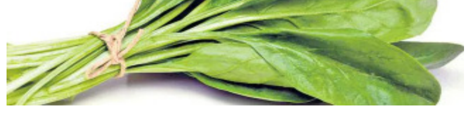
పాలకూర 30 గ్రాములు తీసుకోవాలి. రోజువారీ విటమిన్ ఎ అవసరంలో 16 శాతం లభిస్తుంది. అలానే విటమిన్ కె 120 శాతం అందుతుంది. క్యాన్సర్ ముప్పును పాలకూర తగ్గిస్తుంది.