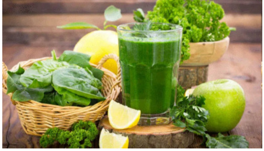
దానిమ్మ జ్యూస్, నిమ్మ, మింట్ తో కొబ్బరి నీళ్లు, డీటాక్స్ పసుపు టీ, తేనె, నిమ్మ, అల్లం టీ, ఆరెంజ్, క్యారెట్, అల్లం డీటాక్స్ డ్రింక్ లెమన్, మింట్ డ్రింక్, కీరా, మింట్ డ్రింక్, పింక్ సాల్ట్, అల్లం డీటాక్స్ వాటర్, జీరా వాటర్