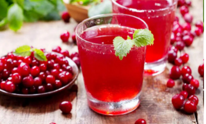
తీసుకోవాలని స్వాగతిస్తున్న సూచిస్తున్నారు. ఇక మధుమేహులకు అనువైన సమ్మర్ డ్రింక్స్ను పరిశీలిస్తే.. సజ్జా సీడ్స్ తో కొబ్బరి నీరు, చియా సీడ్ డ్రింక్, కోకుమ్ షర్బత్, మజ్జిగ, క్రాన్బెర్రీ జ్యూస్, వెజిటబుల్స్ జ్యూస్