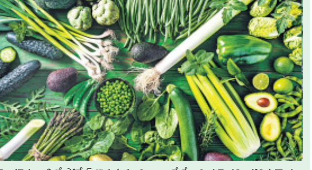
మొదలైన వాటిలో ఫోలేట్ దొరుకుతుంది. అయితే సోంధ్రయమైనవి, హానికరమైన పురుగుమందుల అవశేషాలు లేని పదార్థాలు ఎంచుకోవాలి ఉంటుంది.

ఫోలేట్ను విటమిన్ బి9 అని కూడా పిలుస్తారు. రోజువారీ పసులు, గడ్డిగా ఉన్న సమయంలో పిండం అభివృద్ధిచెందడంలో, తల్లి రక్తంలో హిమోగ్లోబిన్ స్థాయిలు తగినమాత్రాలో ఉండటంలో ఫోలేట్ కీలకపాత్ర పోషిస్తుంది. ఇది తక్కువగా ఉంటే నాడులకు సంబంధించిన రుగ్మతలు వస్తాయి. మెదడు పనితీరు మందగిస్తుంది. ఫోలేట్ వివిధ ఆహార పదార్థాల నుంచి సహజంగానే లభిస్తుంది. ఇక విటమిన్ సప్లిమెంట్లు, ఫోల్లిక్ ఆహారాల్లో మాత్రం దీన్ని ఫోలిక్ యాసిడ్ రూపంలో జతచేస్తారు. అయితే, సహజమైన ఫోలేట్ లా కృత్రిమ ఫోలిక్ యాసిడ్ శరీరంలో కలిసిపోదని కొందరి అభిప్రాయం. కాబట్టి మనం తినే ఆహారంలోనే ఫోలేట్ ఎక్కువగా ఉన్నవాటిని ఎంచుకోవడం మంచిది. పాలకూర, తోటకూర, అవకాడో, పచ్చిబటాణీలు, గ్రెన్ బీన్స్ (ల్యాట్స్), బ్రోకోలి, అవకూర, టమాటాలు, నారింజ, పల్లీలు, అంగూర్లు, పొప్పిడి, ఆరటి వండ్రు, పచ్చసొంతో కూడిన గుడ్లు, జంతు మాంసంలో తినదగిన అవయవాలు (ఆర్గాన్ మిట్స్)