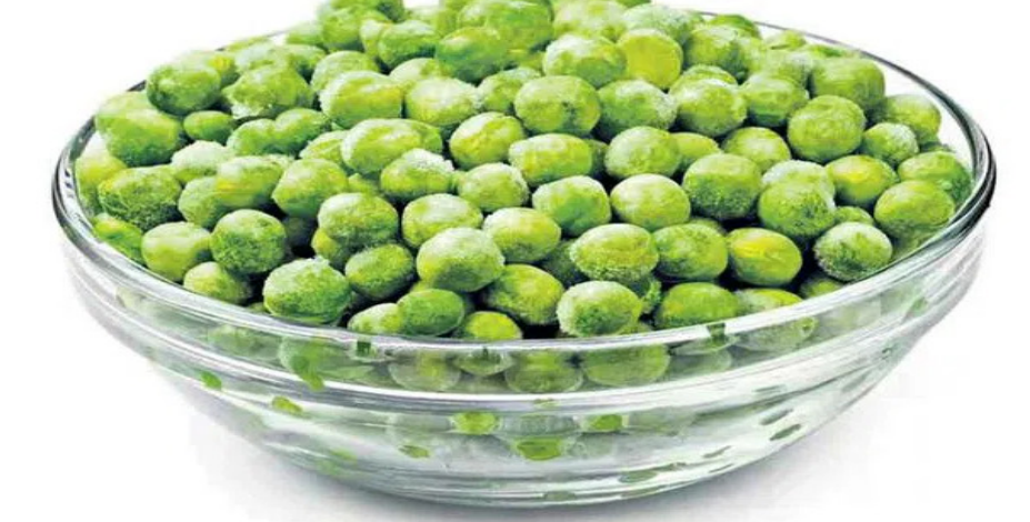
పచ్చి బటానీలు 160 గ్రాముల బటానీల్లో 9 గ్రాముల ఫైబర్, 9 గ్రాముల ప్రోటీన్ ఉంటుంది. ఎ, సి, కె విటమిన్లు, రిటోఫైబిన్, థయామిన్, నియాసిన్ లాంటి బి కాంపెక్స్ విటమిన్లు, ఫోలేట్ సమృద్ధిగా ఉంటాయి. జీర్ణవ్యవస్థ ఆరోగ్యానికి, ట్యూమర్ ముప్పు తగ్గడానికి పచ్చి బటానీలు దోహదపడతాయి.