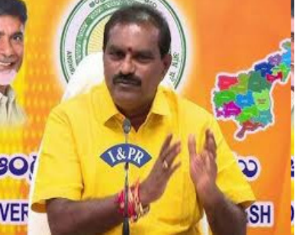
నేషనల్ హైవేల క్రాసింగ్ దగ్గర వంతెనల నిర్మాణ పనులు చేపడతామని చెప్పారు. అనకాపల్లి కేంద్రం అధికారులను మంత్రి ఆదేశించారు. పనులు అలస్థం చేస్తే సమస్య వస్తుంది లేదని ఆధికారులు, ఎజిఎస్సీలను మంత్రి సున్నితంగా హెచ్చరించారు. ఉత్తరాంధ్రలో సాగు, తాగు, పారిశ్రామిక అవసరాలు గోదావరి జలాలు కీలకమన్నారు. ఉత్తరాంధ్రకు గోదావరి జలాలు తరలింపడానికి పోలవరం ఎడమ ప్రధాన కాలువే ఆధారమన్నారు. అనకాపల్లి కేంద్రంగా వస్తున్న భారీ పరిశ్రమలకు నీటి సమస్య లేకుండా ఈ నీటిని అందిస్తామన్నారు. అదేకాక వైసీపీ పాలనలో పోలవరం ఎడమ కాలువ కోసం ఒక్క రూపాయి ఖర్చు చేయలేదని మంత్రి నిమ్మల ఆరోపించారు. పోలవరం లెస్ట్ కెనాల్ పనులను క్రీ. ట్రేజర్ల చేసి ఉత్తరాంధ్ర ప్రజలపై జగన్ గత ప్రభుత్వం కక్ష కల్పించి మందిస్తామన్నారు. పోలవరం ఎడమ కాలువ పనులపై 17,500 క్యూసెక్కులను సీఎం 8,122 క్యూసెక్కులకు తగ్గినట్లు ఉత్తరాంధ్ర ప్రయోజనాలకు నాడు జగన్ గండికొట్టారని మంత్రి నిమ్మల ఆగ్రహించారు. అధికారంలోకి రాగానే సీఎం చంద్రబాబు మొదటి ప్రాధాన్యతగా పోలవరం ప్రాజెక్టును సందర్శిస్తే, రెండో ప్రాధాన్యతగా లెస్ట్ కెనాల్ పనులను పరిశీలించాలని చెప్పారు.

కాకినాడ, నేటిదాట్రీ: ఉత్తరాంధ్రలో సాగు, తాగు, పారిశ్రామిక అవసరాలు తీర్చడంలో గోదావరి జలాలు ఎంతో కీలకమని మంత్రి నిమ్మల రామానాయుడు అన్నారు. ఉత్తరాంధ్రకు గోదావరి జలాలు తరలింపేందుకు పోలవరం ఎడమ కాలువే ప్రధాన ఆధారమన్నారు. అనకాపల్లి కేంద్రంగా వస్తున్న భారీ పరిశ్రమలకు నీటి సమస్య లేకుండా గోదావరి జలాలు అందిస్తామని హామీ ఇచ్చారు. కాకినాడ జిల్లా అస్వస్థులలో పంపా ఆక్సిజన్ వద్ద పోలవరం ఎడమ ప్రధాన కాలువ పనులను మంత్రి నిమ్మల పరిశీలించారు. ఆరంభాది, గవర్నర్ కు సేవలు గ్రామాల దగ్గర హైవే క్రాసింగ్ మంత్రి నిమ్మల పనులను మంత్రి నిమ్మల పర్యవేక్షించారు. అనంతరం తుని ఆర్ అండ్ బీ గెస్ట్ హౌస్లో పోలవరం ఎల్ఎస్సీ పనుల పురోగతిపై ఆధికారులు, ఎజిఎస్సీలతో సమావేశం నిర్వహించారు. జూన్ నాటికి మొదటి దశ పనులు పూర్తి చేసి అనకాపల్లి వరకు గోదావరి జలాలు తరలింపాలని సీఎం చంద్రబాబు ఆశీర్వాదించినట్లు మంత్రి తెలిపారు.