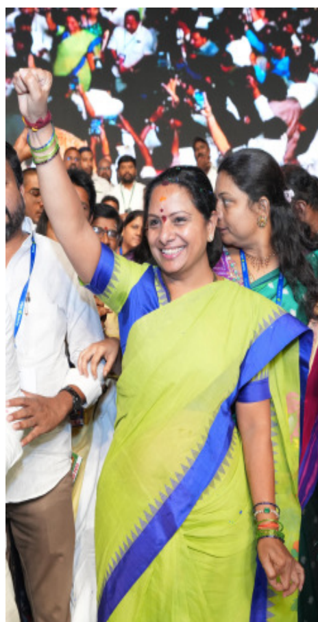
హైదరాబాద్, నేటిధాత్ర: తెలంగాణ రాజకీయ యవనికపై కొత్త పార్టీ ఆవిర్భవించింది. కల్వకుంట్ల కవిత నూతన రాజకీయ పార్టీని ప్రకటించారు. 'తెలంగాణ రాష్ట్ర సేన'గా నామకరణం చేశారు. ఈ మేరకు మేధుల్ జిల్లా మునీరాబాద్ లో ఏర్పాటు చేసిన భారీ సభలో పార్టీ పేరును కవిత ప్రకటించారు. అనంతరం కార్యక్రమాలను ఉద్దేశించి ప్రసంగిస్తూ.. రాష్ట్రంలో ఉన్నమాడు పార్టీలు తెలంగాణ ప్రజల ఆకాంక్షలను నెరవేర్చడం లేదన్నారు.