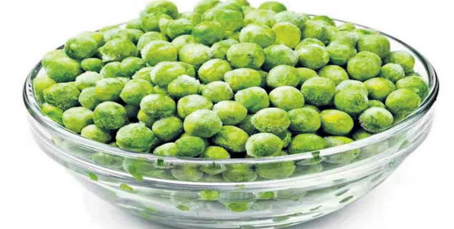
పచ్చి బటానీలు 160 గ్రాముల బటానీల్లో 9 గ్రాముల ఫైబర్, 9 గ్రాముల ప్రోటీన్ ఉంటుంది. ఎ, సి, కె విటమిన్లు, రిబోఫ్లేవిన్, థయామిన్, నియాసిన్ లాంటి బి కాంప్లెక్స్ విటమిన్లు, ఫోలేట్ సమృద్ధిగా ఉంటాయి. జీర్ణవ్యవస్థ ఆరోగ్యానికి, ట్యూమర్ ముప్పు తగ్గడానికి పచ్చి బటానీలు దోహదపడతాయి.