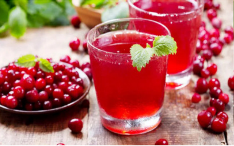
తీసుకోవాలని స్వాగతిస్తున్న సూచిస్తున్నారు. ఇక మధుమేహులకు అనువైన సమ్మర్ డ్రింక్స్ను పరిశీలిస్తే..