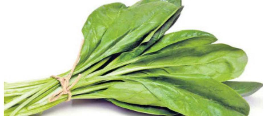
పాలకూర 30 గ్రాములు తీసుకోవాలి. రోజువారీ విటమిన్ ఎ అవసరంలో 16 శాతం లభిస్తుంది. అలానే విటమిన్ కె 120 శాతం అందుతుంది. క్యాన్సర్ ముప్పును పాలకూర తగ్గిస్తుంది.