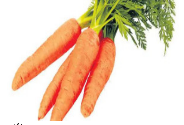
క్యారట్లు 128 గ్రాములు తీసుకోవాలి. వీటిలో విటమిన్ ఎ పుష్కలంగా ఉంటుంది. రోజువారీగా అవసరమైన ఎ విటమిన్లో 119 శాతం దీనినుంచి లభిస్తుంది. క్యాన్సర్ నివారణకు వీటిలో ఉండే బీటా కెరోటిన్ అనే యాంటీ ఆక్సిడెంట్ దోహదపడుతుంది.

మన ఆరోగ్యానికి సమతుల ఆహారమే హామీ ఇస్తుంది. రోజువారీ భోజనంలో అస్పృహను బదులు రకాల రంగురంగుల కూరగాయలను సమపాళ్లలో తీసుకోవాలని పోషకాహార నిపుణులు సూచిస్తున్నారు. ఇలా చేస్తే తినే పళ్లాన్నే కాకుండా మన జీవితాన్ని రంగులమయం చేసుకోవచ్చు, ఆరోగ్యంగా బతికేయచ్చు.