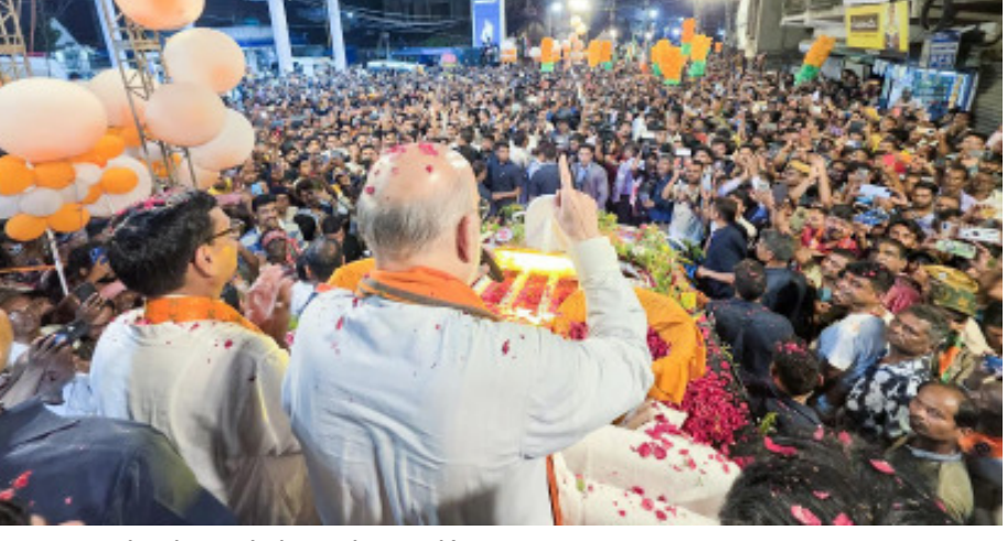
అంటున్నారు. నేను మీకు చెప్పేదేమిటంటే.. 5వ తేదీ రాగలరు. ఏ దుండగుడూ ఆమె వైపు చూడటానికి కూడా తర్వాత, యువతలు రాత్రి 1 గంటల తర్వాత కూడా బయటకు సాహసించడం అమిత్ షా హామీనిచ్చారు.

కోల్కతా, నేటిదాట్రీ: ప్రస్తుతం బెంగాల్ మహిళల భయంతో జీవిస్తున్నారని కేంద్ర హాంతుంత్రి అమిత్ షా అన్నారు. మహిళలు సాధారణం ఏడు తర్వాత బయటికి రావద్దంటూ మమతా బెనర్జీ గతంలో చేసిన వ్యాఖ్యలను అమిత్ షా విమర్శించారు. మే బిల్ తేదీ తర్వాతి నుంచి పశ్చిమ బెంగాల్ మహిళలు రాత్రి ఒంటిగింజ తర్వాత కూడా భయం లేకుండా రోడ్డుపై తిరుగుతున్న అమిత్ షా పేర్కొన్నారు. పశ్చిమ బెంగాల్లోని పూర్వ జన్మజన్మ జిల్లాలోని జమల్పూర్ గ్రామంలో జరిగిన ఎన్నికల రాత్రిలో అమిత్ షా పాల్గొన్నారు. రాష్ట్రంలో మహిళల భద్రత విషయంలో విఫలమయ్యారని ముఖ్యమంత్రి మమతా బెనర్జీపై విమర్శలు గుప్పించారు. 'ఒక మహిళా ముఖ్యమంత్రి ఇలాంటి వ్యాఖ్యలు చేయడం సరైన పాలనకు సంకేతమా?' అని ప్రశ్నించారు. భారతీయ జనతా పార్టీ అధికారంలో ఉన్న అన్ని రాష్ట్రాల్లోనూ మహిళలు ధైర్యంగా ఉన్నారని, మే 5 తర్వాత బెంగాల్ మహిళల పరిస్థితి కూడా మెరుగుపడుతుందని అన్నారు. తల్లులు, సోదరిమణులు వైపు దురుద్దేశంతో చూసేందుకు ఏ దుండగుడు సాహసించినా, వారిని జైలులో పెడతామని భారతీయ జనతా పార్టీ హామీ ఇస్తుందన్నారు. గత పదిహేను సంవత్సరాలు మమతా బెనర్జీ పాలనలో, అత్యధికంగా సభ్యులైన వారు మన తల్లులు, సోదరిమణులే. బెంగాల్లో మహిళలపై ఎన్నో హింసాత్మక ఘటనల జరిగాయి. మహిళలు రాత్రి 7 గంటల తర్వాత ఇళ్ల నుంచి బయటకు రాకూడదని డీడీ