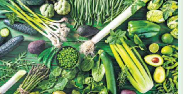
మొదలైన వాటిలో ఫోలేట్ దొరుకుతుంది. అయితే సోంధ్రయమైనవి, హానికరమైన పురుగుమందుల అవశేషాలు లేని పదార్థాలు ఎంచుకోవాలి ఉంటుంది.

ఫోలేట్ను విటమిన్ బి9 అని కూడా పిలుస్తారు. రోజువారీ పసులు, గడ్డిగా ఉన్న సమయంలో పిండం అభివృద్ధిచెందడంలో, తల్లి రక్తంలో హిమోగ్లోబిన్ స్థాయిలు తగినమాత్రాలో ఉండటంలో ఫోలేట్ కీలకపాత్ర పోషిస్తుంది. ఇది తక్కువగా ఉంటే నాడులకు సంబంధించిన రుగ్మతలు వస్తాయి. మెదడు పనితీరు మందగిస్తుంది. ఫోలేట్ వివిధ ఆహార పదార్థాల నుంచి సహజంగానే లభిస్తుంది. ఇక విటమిన్ సప్లిమెంట్లు, ఫోల్లిక్ ఆహారాల్లో మాత్రం దీన్ని ఫోలిక్ యాసిడ్ రూపంలో జతచేస్తారు. అయితే, సహజమైన ఫోలేట్ లా కృత్రిమ ఫోలిక్ యాసిడ్ శరీరంలో కలిసిపోదని కొందరి అభిప్రాయం. కాబట్టి మనం తినే ఆహారంలోనే ఫోలేట్ ఎక్కువగా ఉన్నవాటిని ఎంచుకోవడం మంచిది. పాలకూర, తోటకూర, అవకాడో, పచ్చిబటాణీలు, గ్రెన్ బీన్స్ (ట్రొబ్బీ), బ్రోకోలి, అవకూర, టమాటాలు, నారింజ, పల్లీలు, అంగూర్లు, పాప్ టాటో, అరటి పండ్లు, పచ్చసొంతో కూడిన గుడ్లు, జంతు మాంసంలో తినదగిన అవయవాలు (ఆర్గాన్ మిట్స్)