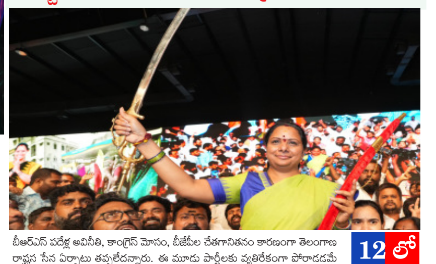
టీఆర్ఎస్ పదేళ్ల అవినీతి, కాంగ్రెస్ మోసం, టీజేపీల చేతగానితనం కారణంగా తెలంగాణ రాష్ట్ర సేన ఏర్పాటు తప్పలేదన్నారు. ఈ మూడు పార్టీలకు వ్యతిరేకంగా పోరాడడమే