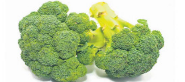
బ్రోకోలీజ్ 91 గ్రాముల బ్రోకోలీ నుంచి రోజువారీ విటమిన్ కె 77 శాతం లభిస్తుంది. విటమిన్ సి 90 శాతం అందుతుంది. అదనంగా ఫోలేట్, మాంగనీస్, పొటాషియం కూడా లభిస్తాయి. ఇది కూడా క్యాన్సర్ ముప్పును తగ్గిస్తుంది. గుండెజబ్బులకు సంబంధించిన ఇన్ఫ్లమేటరీ కారకాలను నియంత్రిస్తుంది.