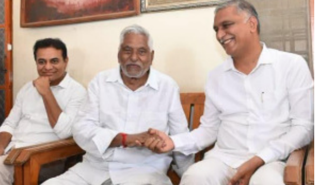
బీజేపీ, కాంగ్రెస్ ఎంపీలు కలిసి కేసీఆర్ సభ విజయవంతమవుతుందని, కేసీఆర్ సీఎం కావడం ఖాయమని అన్నారు. ఈనెల 20న కేసీఆర్ సాయంత్రం 5.30 నిమిషాలకు చేరుకుంటారని వివరించారు. సుమారు గంట సేపు కేసీఆర్ సభ ఉంటుందని కేసీఆర్ చెప్పింది.