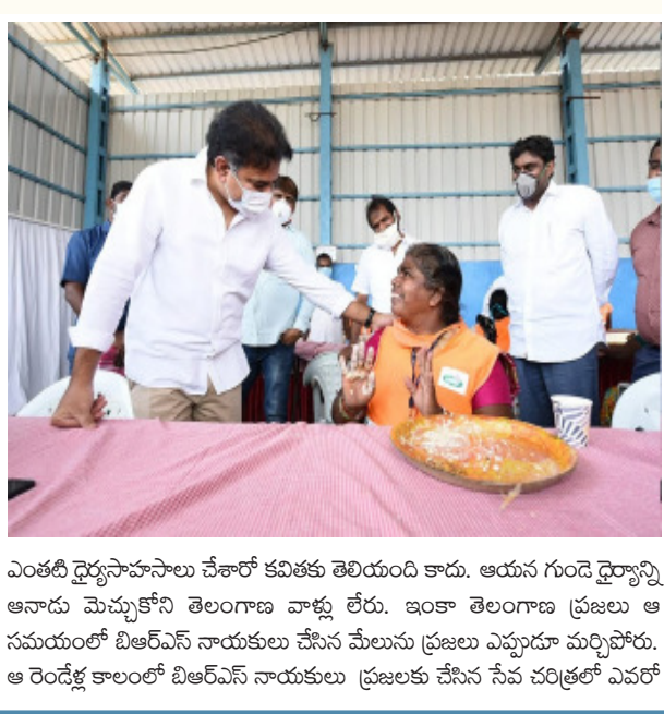
ఎంతటి ధైర్యసాహసాలు చేశారో కవితకు తెలియంది కాదు. ఆయన గుండె ధైర్యాన్ని ఆనాడు మెచ్చుకొని తెలంగాణ వాళ్లు లేరు. ఇంకా తెలంగాణ ప్రజలు ఆ సమయంలో బీఆర్ఎస్ నాయకులు చేసిన మేలును ప్రజలు ఎప్పుడూ మర్చిపోరు. ఆ రెండేళ్ల కాలంలో బీఆర్ఎస్ నాయకులు ప్రజలకు చేసిన సేవ చరిత్రలో ఎవరో

హైదరాబాద్, నేటిధాత్రి: పదేళ్లు పాటి అధికారంలో వున్నప్పుడు కేటీఆర్, ప్రజల్లో లేదన్న కవిత వ్యాఖ్యలు అమానవీయమైవి. అనందర్థమైనవి. అర్థం లేనివి. ఒక వ్యక్తి గురించి మరో వ్యక్తి మాట్లాడే ముందు అవేకతో మాట్లాడుతున్నామా? ఆలోచనతో మాట్లాడుతున్నామా? అని చూసుకొని మాట్లాడితే ఆ వ్యక్తులకు విలువ గౌరవం పెరుగుతాయి. నాలుక వున్న ఆహారం జీర్ణం చేసుకోవడానికే కాదు, అవతలి వారికి జీర్ణమయ్యే మాటలు మాట్లాడాలని పెద్దలు ఎప్పుడో చెప్పారు. రాజకీయాల్లో కొన్ని సార్లు కావాలని అవతలి వ్యక్తిని ఇష్టం లేకున్నా శంకించే విధానం కనిపిస్తుంది. అది కూడా ఒక దశ వరకు మాత్రమే వుంటుంది. ఇటీవల మాజీ ఎమ్మెల్యే కల్యాణ్ కుంట్ల కవిత బీఆర్ఎస్ వర్సెస్ టైమ్స్ టెలివిజన్ గురించి మాట్లాడుతూ అధికారంలో వున్నంత కాలం ప్రజల్లో లేరు. అధికారం పోయిన తర్వాత కేటీఆర్ ప్రజల్లోకి వస్తున్నారని ఎద్దేవా చేశారు. ఇది నిజంగా సరైన వివరణ కాదు. కేటీఆర్ తెలంగాణ ఉద్యమ కాలం నుంచి ఇప్పటి వరకు జనంలోలేకుండా ఏ ఒక్క రోజు లేరు. అధికారం వున్నప్పుడైనా, తెలంగాణ ఉద్యమం చేసినప్పుడైనా, ఇప్పుడైనా ప్రజలకు దూరంగా కేటీఆర్ వున్నారనడం సుమంజసు కాదు. తెలంగాణ రాష్ట్రంలో, రాజకీయాల్లో కేటీఆర్ సైన్యంలా ప్రజల్లో వున్నవారే. వుంటున్న వాళ్లే. అగ్ర నాయకులతోపాటు, నాయకులు, కార్యకర్తలు నిత్యం ప్రజల్లో వున్నవాళ్లే. అలాంటి పార్టీ నాయకుడు ప్రజల్లో లేని చెప్పడం హాస్యాస్పదం. కేటీఆర్ ప్రజల్లో వున్నారా? లేదా? అని చెప్పడానికి కరోనా సమయం ఒక్కటి చాలు. ఆ సమయంలో కేటీఆర్