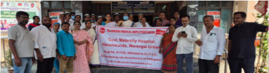
వైద్య ఉద్యోగుల న్యాయమైన డిమాండ్లను పరిష్కరించాలి హనుమకొండ జిఎంహెచ్ వద్ద నిరసన