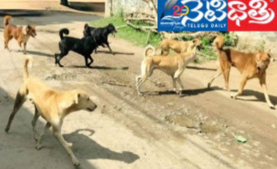
గాయాలపాలై ఆసుపత్రులకు పరుగులు తీసిన విషయం తెలిసినదే అది ఆట ఉండగా ద్వితీయ వాచానాల పై వెళ్ళే వారిని వెంటబిడ్చుండడంతో ప్రమాదాల జారిన పడుతున్నారు. మండలంలో దాదాపుగా ప్రతి గ్రామంలో సుమారు 20 నుంచి 50 వరకు కుక్కలు ఉన్నట్లు సమాచారం పట్టించుకోవాల్సిన అధికారులు నిరక్షం వహించడంతోనే పట్టణంలో పరిసర గ్రామాలలో ఈ పరిస్థితి తెలివితేటలు చెప్పవచ్చు. డింకో వీధుల్లో కుక్కలు గుంపులుగా సంబంధం లేకుండా చిన్నారులు భయాందోళనకు గురవుతున్నారు. వెంటనే అధికారులు స్పందించి కుక్కల నియంత్రణ చర్యలు చేపట్టాలని పలు గ్రామాల ప్రజలు కోరుతున్నారు.

పరకాల, నేటిభిత్తి : పరకాల మండలంలోని పలు గ్రామాలలో ఎక్కడ చూసినా కుక్కల గుంపులు గుంపులుగా స్త్రో విహారం చేయడంతో రాకపోకలు సాగించేందుకు ప్రజలు ఇబ్బందులు పడుతున్నారు. పలుచోట్ల పాఠశాలకు వెళ్ళే విద్యార్థులపై దాడులు దిగుతున్నాయని సమాచారం వీధుల్లో ఎక్కడపడితే అక్కడ ఉండే కుక్కలు దారిన పోయే వారిపై దాడి చేసిన నందర్నాలు గతంలో ఉన్నాయి. వాచానాలపై ప్రయాణించే వారిని కుక్కలు గుంపులుగా వెంటబిడ్చున్నాయని కుక్కల నమస్తృత్త గ్రామస్థులు పంచాయతీ కార్యదర్శులకు, సంబంధిత అధికారులకు ఫిర్యాదులు చేస్తున్నప్పటికీ ఫలితం ఉండటం లేదని ప్రజలు వాపోతున్నారు. గతంలో మాదారం రివారు లలో మూగజీవాల పశువుల పై కుక్కలు దాడులు చేస్తుండడంతో పలువురు