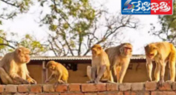
సామానులు దున్నులు ఆహార పదార్థాలు చిందర వందర చేస్తూ భయ భ్రాంతులను సృష్టిస్తున్నాయి దీంతో ప్రజలు తీవ్ర ఇబ్బంది దులు ఎదుర్కొన్నారని వస్తుంది రోడ్లపైకి వెళ్లాలంటే ప్రజలు జంతువులపై విద్యార్థులు పాఠశాలకు వెళ్లాలంటే భయపడుతున్నారు. మండల కేంద్రంలో ప్రభుత్వ పాఠశాలల వద్ద, హాస్టల్ వద్ద విద్యార్థులను తీవ్ర ఇబ్బందులు గురిచేస్తున్నాయి ఇప్పటికైనా సంబంధిత గ్రామ పంచాయతీ అధికారులు మండల అధికారులు ప్రభుత్వం స్పందించి కోతుల బెడద నివారణకు చర్యలు చేపట్టాలని ప్రజలు కోరుతున్నారు.

శాయంపేట, నేటిభిత్తి : శాయంపేట మండలంలో కోతులు హడలెత్తిస్తున్నాయి. కుక్కలను మించి కోతులు భయమే మండలంలోని ప్రజలు ను వెంటాడుతుంది మండల కేంద్రంలోని అన్ని గ్రామాలలో ఇదే తంతు జరుగుతుంది. చిన్నపిల్లలను కోతులు దాడి చేసి తీవ్రంగా గాయపడే చారు. కోతుల బెడద తీవ్రంగా ఉండని మహిళలు ప్రజలు చిన్నపిల్లలు భయపడుతున్నారు. వనం వీడింది జనంలోకి వచ్చింది మీ ఊరకావాలి ఇంటికి వచ్చా అంటూ ఇప్పటికే ఊర్లో సెటిల్ అయింది. కారులు వండే కాదు మనుషులని జంకే ఫుడ్ గడివిన తాళాం నుంచి కోతుల జనాభా అంతకంతా పెరుగుతున్నది ఇప్పుడు మండల కేంద్రంలో తక్కువలో తక్కువగా