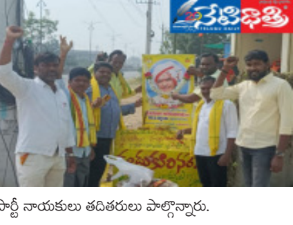
పార్టీ నాయకులు తదితరులు పాల్గొన్నారు.