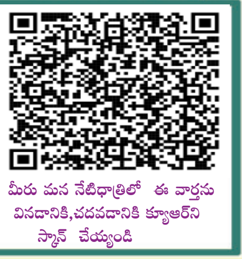
మీరు మన నేటిభిత్తిలో ఈ వార్తను వినడానికి, చదవడానికి క్యూఆర్ కోడ్ స్కాన్ చేయండి