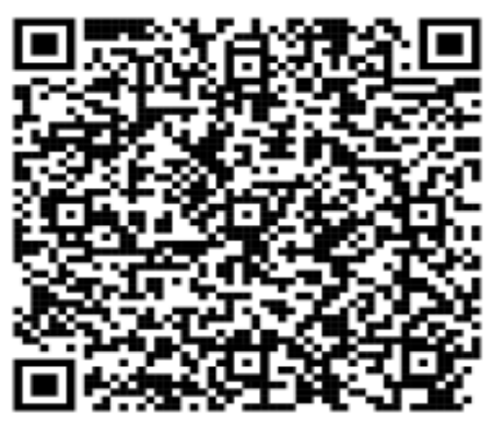
వినడానికి, చదవడానికి క్యూఆర్ కోడ్ స్కాన్ చేయండి