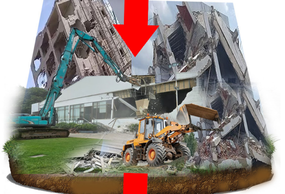
చెరువులను కాపాడేందుకు ప్రాణా దళకంఠం బుల్లోజర్లు తో అవసరం అంతం