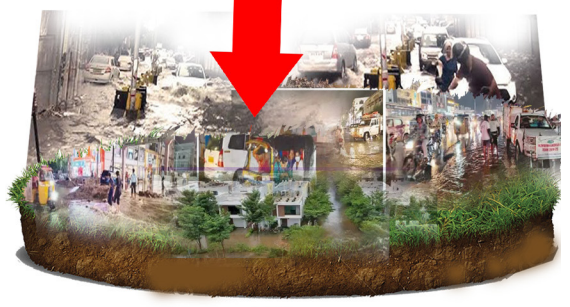
ప్రకృతి ప్రజోపాధికి లక్షకుణల లక్షకృతి ఇని!