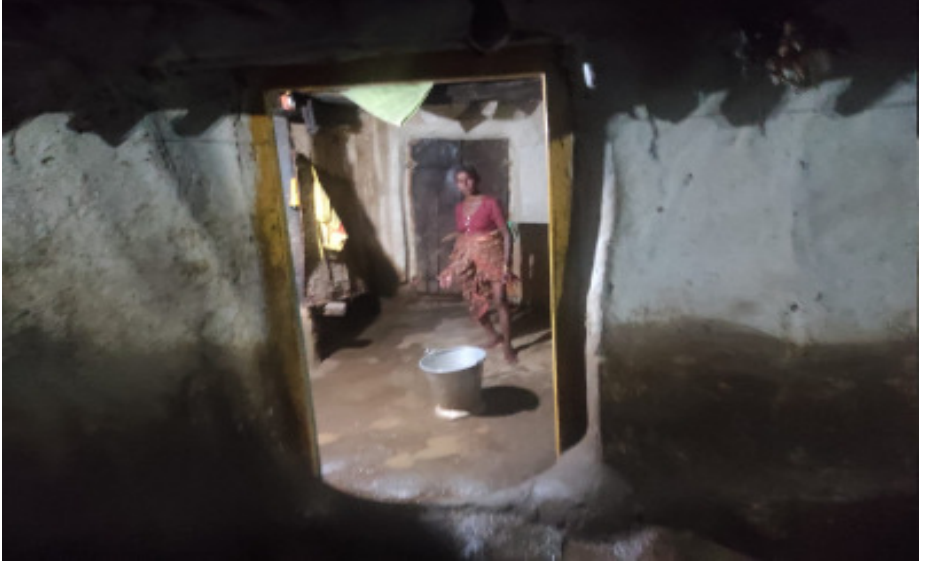
మండల కేంద్రంలో ఇంట్లో వచ్చిన వర్షనీరును ఎత్తివేస్తున్న మహిళ

మహాదేవపూర్, నేటిధాతి: గత వారం రోజులుగా కురుస్తున్న వర్షాల కారణంగా మహాదేవపూర్ ఉమ్మడి మండలం వరద తాకిడికి గురికావడం జరిగింది. ఈ క్రమంలో గత రెండు రోజుల నుంచి ఏడతెరవకుండా కురుస్తున్న భారీ వర్షానికి ఉమ్మడి మండలం అంతా జలమయంగా మారింది.