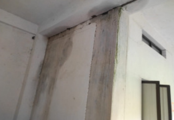
డిగ్రీ కళాశాలలో కురుస్తున్న భవనం

మహాదేవపూర్, నేటిధాతి: గత వారం రోజులుగా కురుస్తున్న వర్షాల కారణంగా మహాదేవపూర్ ఉమ్మడి మండలం వరద తాకిడికి గురికావడం జరిగింది. ఈ క్రమంలో గత రెండు రోజుల నుంచి ఏడతెరవకుండా కురుస్తున్న భారీ వర్షానికి ఉమ్మడి మండలం అంతా జలమయంగా మారింది.