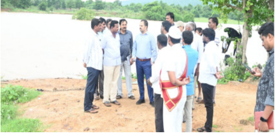
చెరువును పరిశీలిస్తున్న జిల్లా కలెక్టర్