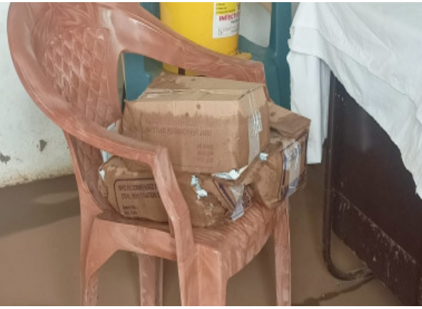
బొమ్మ పూర్ పి హెచ్ సి సబ్ సెంటర్లో తడిసిన ఔషధాలు

ఉంది, మరోవైపు పెద్దపేట వాగు భారీగా వరద నీటితో ఉప్పొంగడం జరుగుతుంది. అంతేకాకుండా మండలంలోని ఎర్ర చెరువు, మందరి చెరువు ఇప్పటికీ భారీగా వరద నీరు చేరి ఉంది.