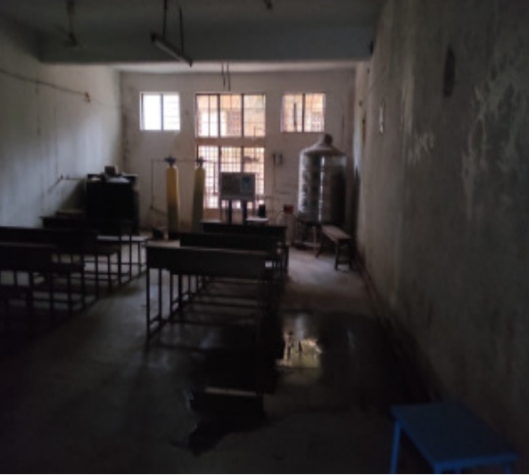
జూనియర్ కళాశాల ఆర్ ఓ వాటర్ ప్లాంట్ గదిలో వర్షపు నీరు.