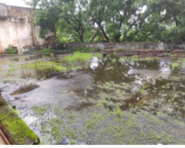
జూనియర్ కళాశాల అంతస్తు పై ఆగి ఉన్న వర్షపు నీరు