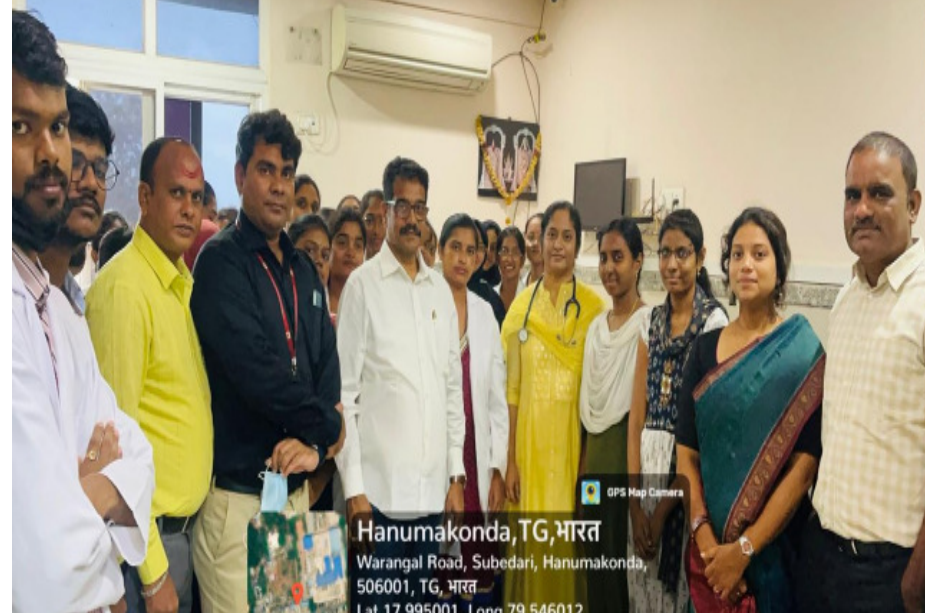
Hanumakonda, TG, AP Warangal Road, Subedari, Hanumakonda, 506001, TG, AP Tel: 17 9850501, 1998 79 546612