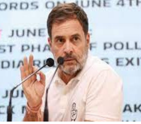
శాసనసభలో అప్పటి ప్రతిపక్ష నాయకుని హోదాలో నిర్ణయాన్ని ద్వారా కర్నాటక ప్రదేశ్ కాంగ్రెస్ కమిటీ (కెసిసీ) ఆ ప్రకటనలను జారీ చేసిందని బిజెపి తన ఫిర్యాదులో ఆరోపించింది. రాహుల్ గాంధీ ఆ 'పరువునష్టం కలిగించే ప్రకటన'ను తన సామాజిక మాధ్యమాలలో 'ఎన్టీ' పోస్ట్ లో పొందుపరిచారని బిజెపి పేర్కొన్నది. రాహుల్ గాంధీ స్వయంగా కోర్టు ముందు హాజరైన తరువాత బిజెపి 'ఎన్టీ' పోస్ట్ లో వ్యాఖ్యానిస్తూ, 'నేషనల్ హెరాల్డ్ కేసులో డియల్ పై విరుద్ధమైన నిందితుడు రాహుల్ గాంధీ ! నమ్మ బెంగళూరుకు మారు స్థానం. కర్నాటకలోని మా నేతలపై మీరు ఉపయోగించిన, ఇప్పటి వరకు మీరు రుజువు చేయలేకపోయిన తప్పుదారి పట్టింకే, పరువునష్టం పురస్కార ప్రకటనలకు నందించి భారతీయ చట్టాల పరిణామాలను అనుభవించేందుకు మీకు స్వాగతం పలుకుతున్నాం' అని పేర్కొన్నది.