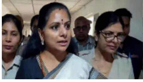
తీసుకున్నది. తాను చదువుకోవడానికి కొత్తగా 9 పుస్తకాలు అందించారు. కవితకు కవిత కోరింది. కవిత అభ్యర్థనను రౌన్ అవెన్యూ కోర్టు అంగీకరించింది.

న్యూఢిల్లీ, నేటిదాటి: ఢిల్లీ మద్యం కేసులో మరో కీలక పరిణామం చోటుచేసుకుంది. ఈ కేసులో నిందితురాలిగా ఉన్న బిఆర్ఎస్ ఎమ్మెల్యే కవితకు జ్యూడిషియల్ కస్టడీ కోరుతూ శుక్రవారం సీబీఐ అధికారులు రౌన్ అవెన్యూ కోర్టును ఆశ్రయించారు. దీంతో మరోసారి కవితకు జ్యూడిషియల్ కస్టడీ పొడిగింపింది. జూన్ 21 వరకు రౌన్ అవెన్యూ కోర్టు కవితకు కస్టడీ పొడిగించింది. తదుపరి మరణాంశం జూన్ 21వ తేదీకి కోర్టు వాయిదా వేసింది. అదే రోజు సీబీఐ చార్జీషీట్ పరిగణనలోకి తీసుకునే అంశంపై రౌన్ అవెన్యూ కోర్టు విచారణ జరపనున్నది. సీబీఐ కేసులో కవితపై దాఖలైన చార్జీషీట్ ను కోర్టు విచారణకు