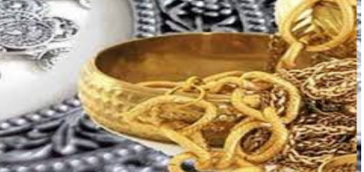
విజయవాడ రేట్ అమలువుతోంది.

పూర్ణాల్లో 96,100 గా ఉంది. ఏపీ, తెలంగాణవ్యాప్తంగా ఇదే ధర అమల్లో ఉంది. విజయవాడలో 10 గ్రాముల 24 క్యారెట్ల బంగారం ధర 73,420 వద్దకు; 22 క్యారెట్ల అర్జుమెంట్ల బంగారం ధర 67,300 వద్దకు; 18 క్యారెట్ల బంగారం ధర 55,060 వద్దకు చేరింది. ఇక్కడ కిలో వెండి ధర 96,100 గా ఉంది. విశాఖపట్టణం మార్కెట్లో బంగారం, వెండికి