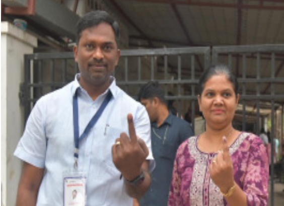
కుటుంబ సభ్యుల తో ఓటు హక్కును వినియోగించుకున్న హైదరాబాద్ జిల్లా ఎన్నికల అధికారి జి హెచ్ ఎం సి కమిషనర్ రోనాల్డ్ రోస్

తెలంగాణలో మావోయిస్టు ప్రభావిత ప్రాంతాలైన 13 అసెంబ్లీ నియోజకవర్గాల్లో సాయంత్రం 4 గంటలకు పోలింగ్ ముగిసింది. సాయంత్రం 4 గంటలకు క్యూలైన్లలో నిల్చున్న వారందరికీ ఓటేసేందుకు అధికారులు అవకాశం కల్పిస్తున్నారు. మిగిలిన 106 అసెంబ్లీ సెగ్మెంట్లలో సాయంత్రం 6 గంటలకు పోలింగ్ కొనసాగింది. మహబూబాబాద్, పెద్దపల్లి, ఆదిలాబాద్, ఖమ్మం, వరంగల్ లోక్సభ నియోజకవర్గాల పరిధిలోని సమస్యాత్మకమైన 13 అసెంబ్లీ నియోజకవర్గాల్లో ఉదయం 7 గంటలకు పోలింగ్ ప్రారంభమైంది. సాయంత్రం 4 గంటల వరకు కొనసాగింది. సిర్సాద్, ఆసిఫాబాద్, చెన్నూరు, బెల్లంపల్లి, మంచినాటి, మంధని, భూపాలపల్లి, ములుగు, పినపాక, ఇల్లెందు, భద్రాచలం, కొత్తగూడెం, అశ్వారావుపేట నియోజకవర్గాల్లో పోలింగ్ ప్రక్రియ ముగిసింది.