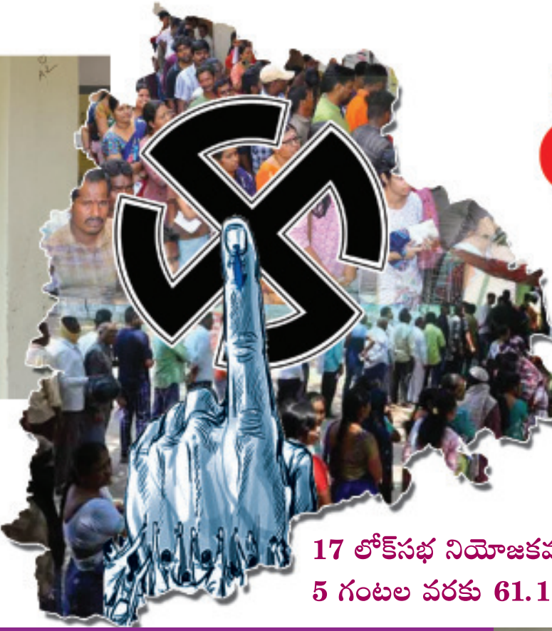
17 లోక్సభ నియోజకవర్గాల్లో సాయంత్రం 5 గంటల వరకు 61.16 శాతం పోలింగ్