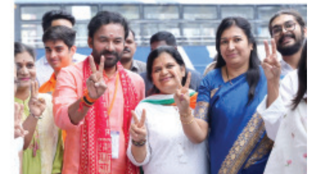
ఓటు హక్కును వినియోగించుకున్న తెలంగాణ రాష్ట్ర బీజేపీ అధ్యక్షులు కిషన్ రెడ్డి