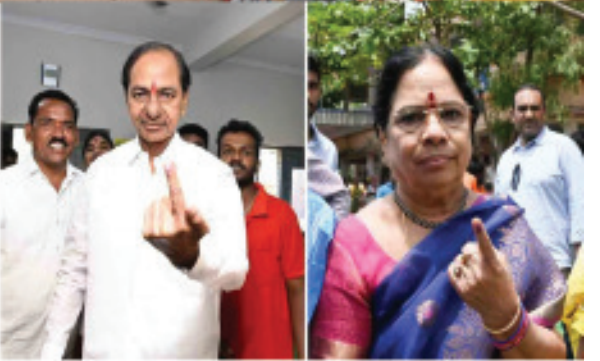
చింతమడకలో ఓటేసిన బీఆర్ఎస్ అధినేత కేసీఆర్ దంపతులు