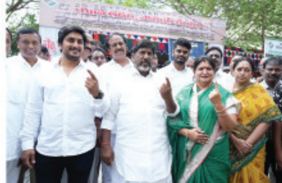
ఓటు హక్కును వినియోగించుకున్న డిప్యూటీ సీఎం మల్ల భట్టి విక్రమారావు