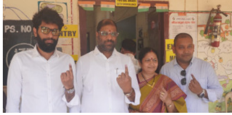
కుటుంబ సమేతంగా ఖమ్మంలో ఓటు హక్కు వినియోగించుకున్న ఎంపీ వద్దిరాజు రవిచంద్ర