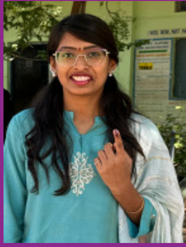
ఓటు హక్కు వినియోగించుకున్న నేటిధాత్రి డైరెక్టర్ కట్టా ఫణిధాత్రి