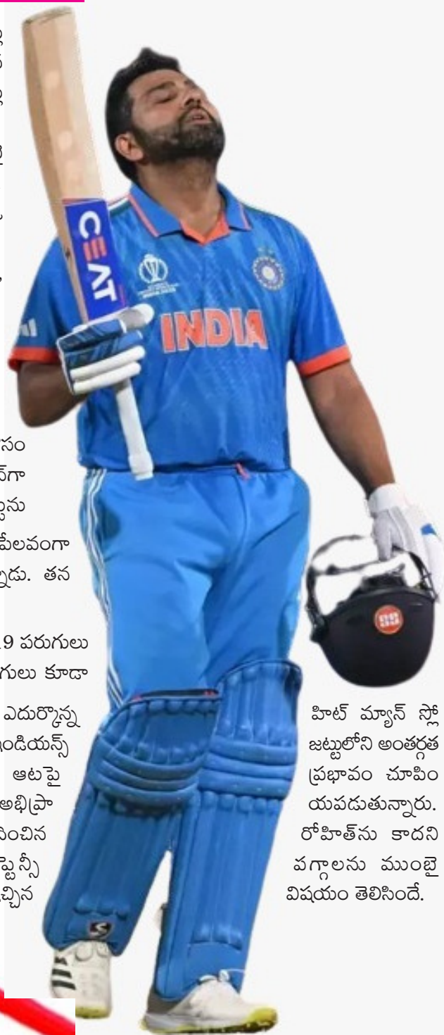
హిట్ మ్యాన్ స్ట్రో జట్టులోని అంతర్గత ప్రభావం చూపించుచున్నాడు. రోహిత్ ను కాదని వగ్గాలను ముంబై విషయం తెలిసింది.

విమర్శలకు దారితీసింది. 24 బంతులు ఎదుర్కొన్న ఇన్నింగ్స్ ఆడాడు. అయితే ముంబై ఇండియన్స్ విభేదాల కారణంగా రోహిత్ ఆటపై దేమో అని విశ్లేషకులు అభిప్రాయం వ్యక్తం చేశారు. అయితే వైస్ కెప్టెన్ గా హార్దిక్ కు కెప్టెన్ పదవి ప్రాంచైజీ ఇచ్చిన