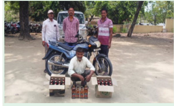
వనపర్తి, నేటిదాటి :