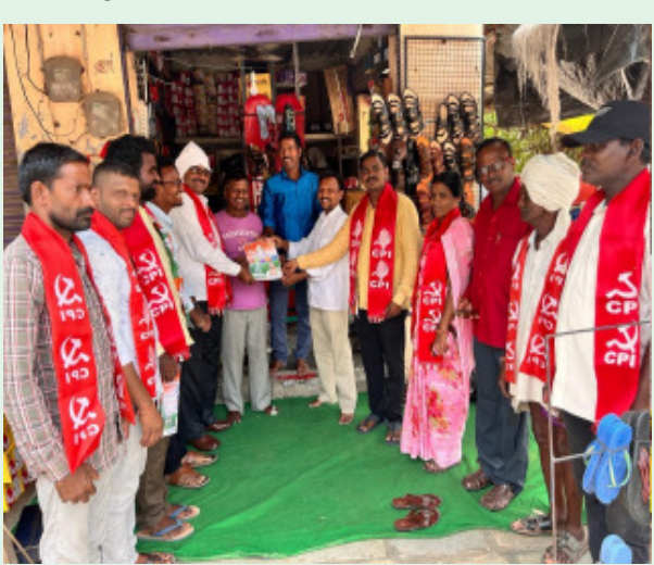
చేర్యాల, నేటిదాటి :