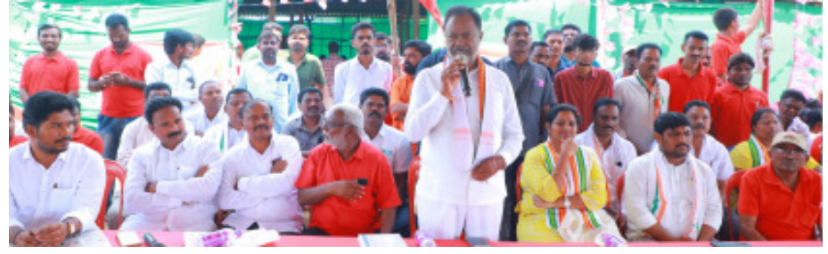
ఎమ్మెల్యే గండ్ల సత్యనారాయణ రావు