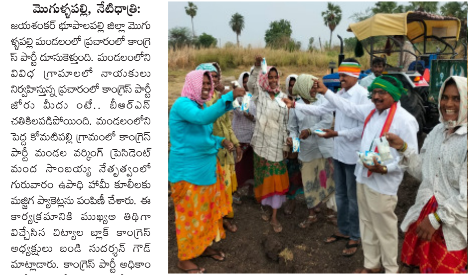
ఐదు గ్యారంటీలు అమలవుతున్నాయని, ఈ గ్యారంటీ పథకాలతో ప్రజలు సంతోషంగా జీవిస్తున్నారన్నారు.

➤ మండలంలో కాంగ్రెస్ జోరు.. బీఆర్ఎస్ బేజారు