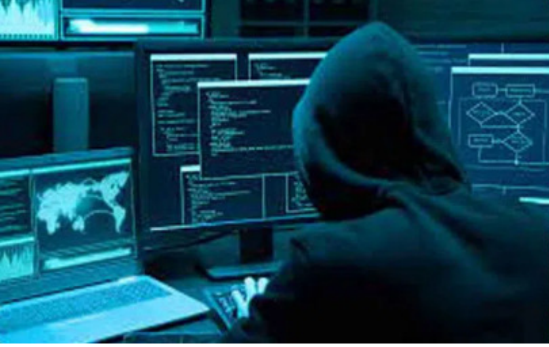
తరుకున్న బాధితుడు సీసీఎస్ సైబర్ క్రైమ్ పోలీసులకు ఫిర్యాదు చేయడంతో, కేసు నమోదు చేసుకొని దర్యాప్తు చేపట్టారు.

సిటీబ్యూరో, నేటిదాటి: సిటీబ్యూరో మీ పేరుతో వచ్చిన ఫెడెక్స్ కొరియర్లో డ్రగ్స్, గడువు తీరిన ఏడు పానీపోర్లు ఉన్నాయంటూ ముంబై సైబర్ క్రైమ్ అఫీసర్స్ పేరుతో బెదిరించిన సైబర్ నేరగాణుడు ఓ మాజీ ఉద్యోగి నుంచి ఆన్లైన్ ద్వారా రూ.50 లక్షలు దోచేశారు. పోలీసుల కథనం ప్రకారం.. నగరానికి చెందిన బాధితుడికి ఓ కాలి వచ్చింది. ముంబై సైబర్ క్రైమ్ అఫీసర్ నుంచి మాట్లాడుతున్నట్లు చెప్పారు. మీరు వెంటనే వీడియో కాల్ లోకి రావాలంటూ చెప్పి, స్కైప్ లో వీడియో కాల్ చేశారు. మీ పేరుతో వచ్చిన పార్సెల్ కు మీ ఆధార్ కార్డు, మొబైల్ సంబంధ బిల్స్ అయి ఉన్నాయని, అందులో డ్రగ్స్ ఉన్నాయంటూ బెదిరించారు. మా విచారణకు మీరు సహకరించకపోతే వెంటనే హైదరాబాద్ లో ఉండే పోలీసులు వచ్చి మిమ్మల్ని అరెస్ట్ చేస్తారంటూ ఒత్తిడి చేశారు. మీ పేరుతో 20 బ్యాంకు ఖాతాలు ఉన్నాయని, అన్నింటికీ ఈ ఆధార్ ఉపయోగించాలంటూ స్కైప్ లో మాట్లాడారు. మీ వద్ద ఉన్న బ్యాంకు ఖాతాల వివరాలు చెప్పండంటూ బాధితుడి వద్ద నుంచి హెచ్బీఎఫ్సీ, ఎస్బీఐ బ్యాంకు ఖాతాల వివరాలను తీసుకున్నారు. ఆ బ్యాంకు ఖాతాలో ఉన్న రూ. 49,35,134 నగదును నేరగాణుడు ఖాతాలో బదిలీ చేసుకున్నారు. కేసు విచారణ జరుగుతున్నదని, డబ్బు తిరిగి మీకే ఇప్పిస్తామంటూ సమ్మింది, ఆ డబ్బులన్ని కాజేశారు. ఆ షాక్ నుంచి