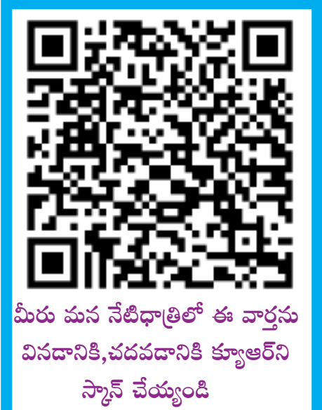
మీరు మన నేటిధాత్రిలో ఈ వార్తను వివదానికి,చదవడానికి కూర్చోండి స్వామి చేయండి