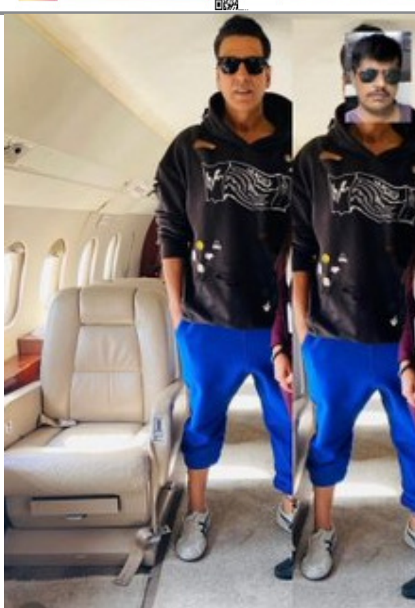
రాజ్ కపూర్ కు చెప్పిన చెబుతూ ఫుల్ ఖుషీ చేస్తున్నాడు. తాజా ప్రాజెక్టులో అక్షయ్ కుమార్, అర్జున్ వర్మ, సౌరభ్ శుక్లా మరోసారి సిల్వర్ స్క్రీన్ పై మెరుబోతున్నారు. ఈ క్రేజీ కాంబో బాక్సాఫీస్ ను షేక్ చేయడం గ్యారంటీ అని ఇప్పుడు తెగ చర్చించుకుంటున్నారు సిని జనాలు.