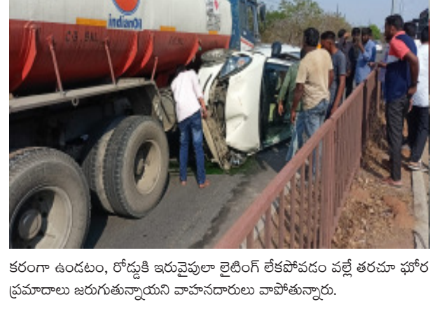
కరంగా ఉండటం, రోడ్డుకి ఇరువైపులా లైటింగ్ లేకపోవడం వల్ల తరచూ ఘోర ప్రమాదాలు జరుగుతున్నాయని వాహనదారులు వాపోతున్నారు.

జైపూర్, నేటిధాతి: మంచినీరూల చెన్నూరు రహదారిపై శుక్రవారం రోజున ఇందారం ఎక్స్ రోడ్ సమీపంలో ఆయిల్ ట్యాంకర్ లో కారు ను ఢీకొట్టడం జరిగింది. వివరాలలోకి వెళితే మంచినీరూల వైపు నుండి చెన్నూరు వైపు లాల్ మరియు కారు ఒకదాని వెనుక ఒకటి ప్రయాణిస్తున్న సమయంలో ముందు వెళ్తున్న కారును లాల్ ఢీకొనడం జరిగింది. ప్రమాదంలో ఎవరికి ప్రాణహాని లేదని తెలిసింది. ప్రమాదంలో కారు నుజ్జు నుజ్జు అయింది. ఎప్పుడు ట్రాఫిక్ తో రద్దీగా ఉండే ఈ రహదారి విశాఖంగా ఉండడానికి బదులుగా ఇర్రుగా ఇబ్బంది